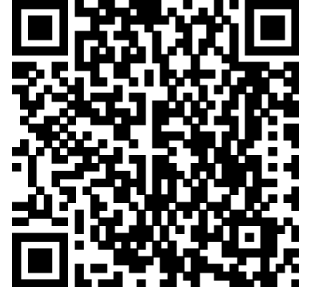
Informations extraites Sunday 20 May 2012 à 02:53:44, heure de Paris. Document non contractuel.